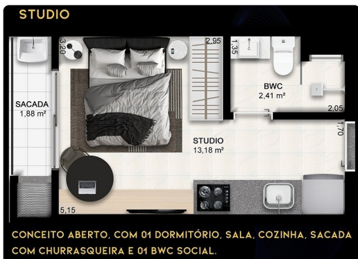
CONCEITO ABERTO, COM 01 DORMITÓRIO, SALA, COZINHA, SACADA COM CHURRASQUEIRA E 01 BWC SOCIAL.

Localização Avenida Juscelino Kubitschek, 1197 - 308 - Balneário Caiobá - Matinhos - PR