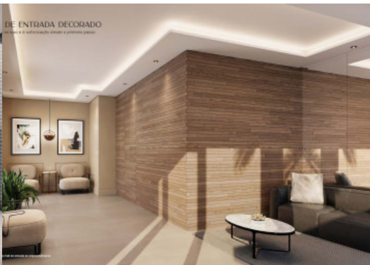
DE ENTRADA DECORADO